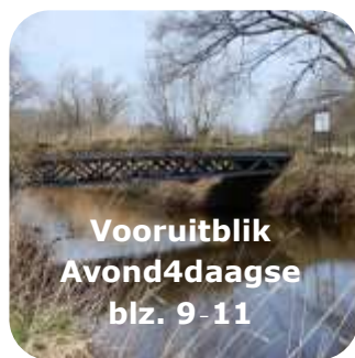
Vooruitblik Avond4daagse blz. 9-11