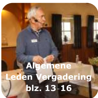
Algemene Leden Vergadering blz. 13-16