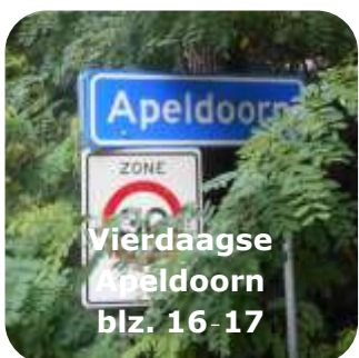
Vierdaagse Apeldoorn blz. 16-17