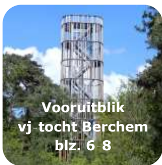
Vooruitblik Vj-tocht Berchem blz. 6-8